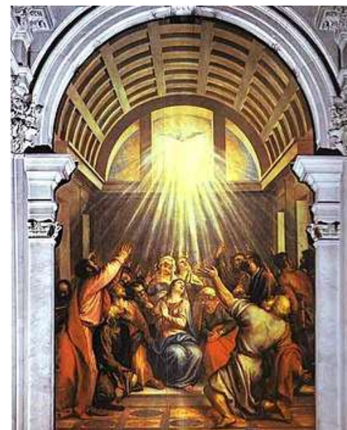
(Discesa dello Spirito Santo – Tiziano)

25 Stavano presso la croce di Gesù sua madre, la sorella di sua madre, Maria di Clèofa e Maria di Màgdala. 26 Gesù allora, vedendo la madre e lì accanto a lei il discepolo che egli amava, disse alla madre: «Donna, ecco il tuo figlio!». 27 Poi disse al discepolo: «Ecco la tua madre!». E da quel momento il discepolo la prese nella sua casa.