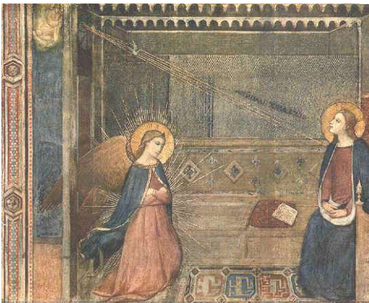
(S. Maria Annunziata Anonimo – Edicola della Madonna Annunziata - Firenze)