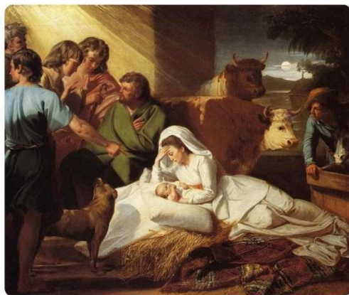
(Natività – J.Singleton Copley)

Luca 2 16 Andarono dunque senz' indugio e trovarono Maria e Giuseppe e il bambino, che giaceva nella mangiatoia. 17 E dopo averlo visto, riferirono ciò che del bambino era stato detto loro. 18 Tutti quelli che udirono, si stupirono delle cose che i pastori dicevano. 19 Maria, da parte sua, serbava tutte queste cose meditandole nel suo cuore.